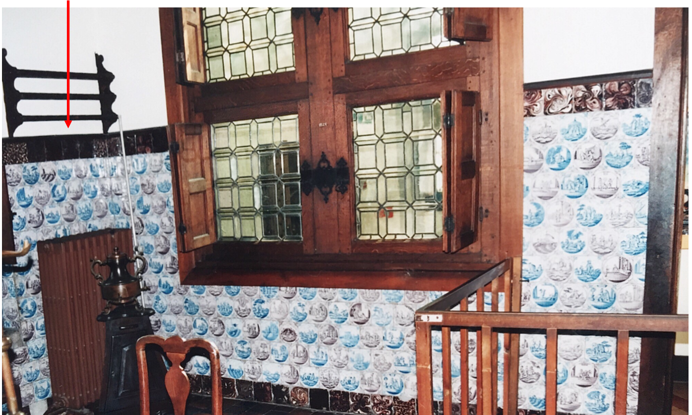
Locaties van de foto's in muur E