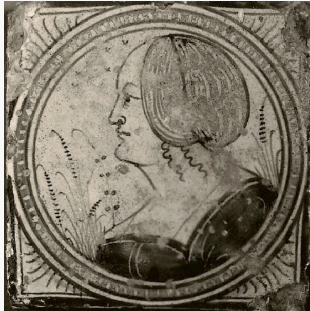
Afb. 4b: Tegels met vrouwenbuste in koord, Antwerpen, 1532. Afkomstig uit de bevloering van de abdij van Herckenrode.