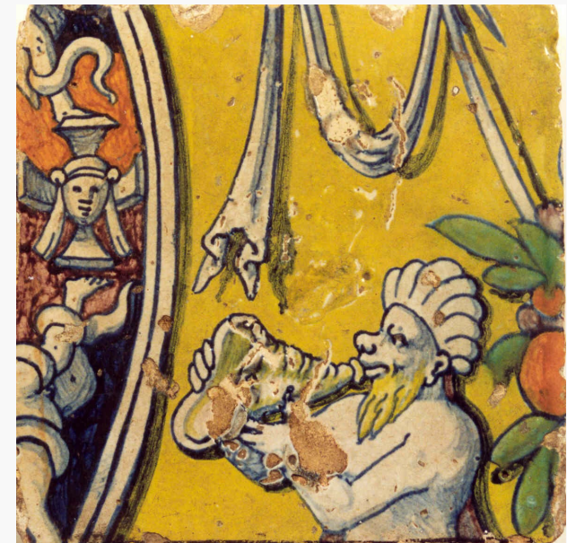
Afb. 3c: Tegel uit een tableau. Fragmentarische voorstelling van een sater die in een conische zeeschelp blaast, aangevuld met draperieën, vruchten, bladeren en fragmenten van ornamenten; geel, blauw, oranje, groen en man-gaanpaars, Antwerpen, omstreeks 1550.

betekende, en had hij de financiële middelen en de status om leerlingen in dienst te nemen. Dit alles is zo maar niet in een mum van tijd opgebouwd. We kunnen daarom rustig stellen dat Guido di Savino reeds meerdere jaren vóór de ondertekening van het leerlingcontract in Antwerpen is aangekomen; 1506-1507 is niet zo onwaarschijnlijk; zelfs 1505 lijkt nog aannemelijk.