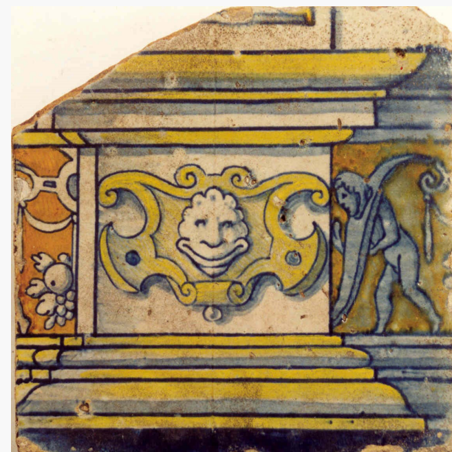
Afb. 3a: Tegel met voorstelling van een pilasterbasement. Versierd met grotesk masker in cartouche; links de aanzet van een arabeskenfries, rechts het begin van een kinderfries; blauw, geel en oranje, Antwerpen, omstreeks 1550.

De belangrijkheid van de Burbure's ontdekking wordt het best weergegeven door de woorden van Pieter Génard, stadsarchivaris van Antwerpen, die de mededeling van de Burbure aan de Academie besluit met de uitspraak: "Het is een hele artistieke industrie die onze achtbare confrater aan de stad Antwerpen teruggeeft." 9