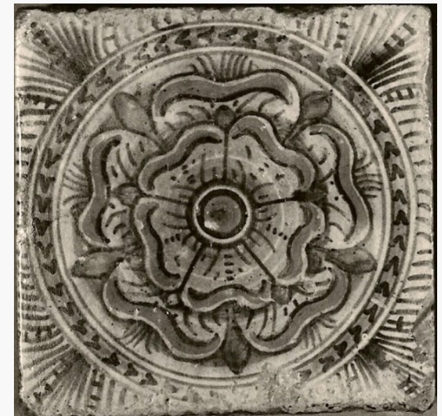
Afb. 4a: Tegel met bloemmotief in koord; motief dat ook op albarelli en schotels voorkomt, Antwerpen, 1532. Afkomstig uit de bevloering van de abdij van Herckenrode.