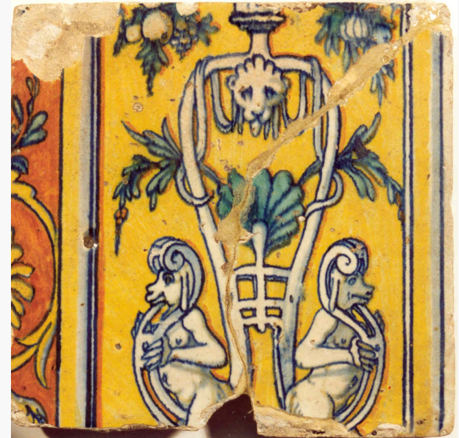
Afb. 3b: Pilastertegel. Ferronnerie-ornament waarin een palmet, een leuwenkop en twee saterachtige figuurtjes; links fragmenten van ranken; geel, blauw, oranje en groen, Antwerpen, omstreeks 1550.

meerdere exemplaren van zijn vakmanschap heeft nagelaten, met inbegrip van een meesterstuk [ De bekering van Saulus ], dienen we te aanvaarden dat de twee, één en dezelfde persoon zijn." 13