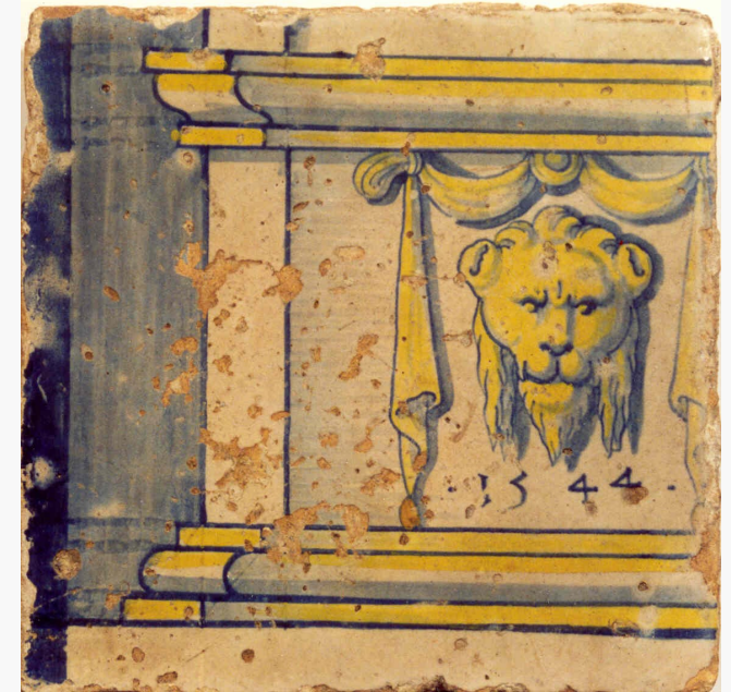
Afb. 2: Hoekrandtegel. Pilasterbase­ment ver­sierd met leeuwenmuil in drapering, waaron­der het jaartal 1544; blauw en geel op witte grond, Antwerpen. Uit het huis "den Salm" in de Kammenstraat.

We krijgen hier een informatie doorgespeeld die van onschatbare waarde is voor de studie van de majolica-industrie te Antwerpen. Tot op dat ogenblik had niemand eerder deze voor de Antwerpse majolica zo belangrijke paragraaf opgemerkt; zelfs Gerrit Paape in zijn boek "De Plateelbakker of Delftsch Aardewerkmaaker" uit 1794, waarin eigenlijk min of meer dezelfde materie als deze in de "Arte del Vasajo" behandeld wordt, vernoemt noch Piccolpasso, noch Guido di Savino. Paape situeert trouwens het ontstaan van de aardewerkindustrie in de Nederlanden pas rond het midden van de 17de eeuw, een honderdtal jaren dus na Piccolpasso's verhandeling en meer dan honderd jaar na het vermoedelijk tijdstip van Guido di Savino's verblijf te Antwerpen. 7