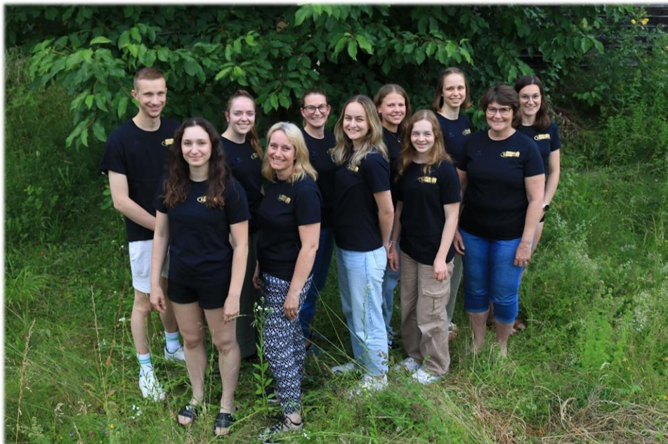
Leiterteam Geräteturnen Sportverein SATUS Oberentfelden und Organisator Geräteturn-Frühlingswettkampf