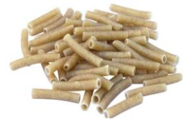
Pâtes et confiture à maquereau de la marque terra etica