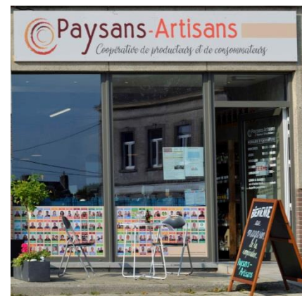
Le magasin Paysans-Artisans de Saint-Gérard.

La coopérative emploie directement 22 personnes, ainsi qu'une dizaine d'autres via un système de partage de main-d'œuvre dans le cadre d'un groupement d'employeurs.