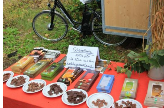
Agriculteurs bavarois promouvant "leur" chocolat équitable

Fondé sur une expérience de plus de 30 ans dans le domaine de la certification biologique et sur des échanges de savoir-faire avec des organisations équitables reconnues, ce label paraît aussi exigeant que son grand frère biologique. Par exemple, les produits affichant le logo "Naturland Fair" logo doivent être composés autant que possible de 100 % d'ingrédients équitables et "cela vaut pour le lait ou le blé d'Allemagne ainsi que pour des produits tels que le café ou les fruits tropicaux".