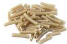
Pasta en kruisbessenconfituur van het merk 'terra etica'