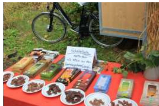
Beierse landbouwers die 'hun' eerlijke chocolade promoten