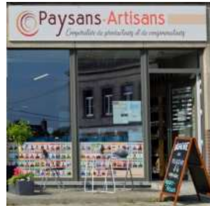
De winkel van Paysans-Artisans in Saint-Gérard.

De ambitie van Paysans-Artisans : de commercialisering via korte keten uitbouwen en professionaliseren, met het doel de korte keten een reële economische basis te verschaffen en de kleine boeren en artisanale producenten te ondersteunen.