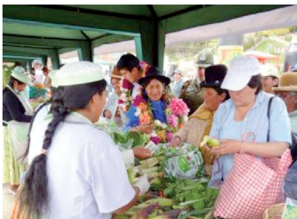
AOPEB : "Het is essentieel dat we de lokale cultuur valoriseren en de traditionele kennis bewaren die vanouds de natuur respecteert en een duurzaam beheer van de hulpbronnen bevordert."

Nu PGS beschouwd worden als waardevolle alternatieven voor de derde partij certificering, die kleine producenten toegang geven tot de lokale markt, is de tijd gekomen om PGS te erkennen als systemen die gelijkwaardig zijn aan de derde partij controle.