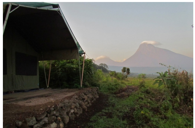
Tentenkampen, heropgebouwd door lokale inwoners

Daarnaast werken ze mee activiteiten uit voor de reizigers, zoals ontmoetingen met gorilla's, trektochten langs vulkanen, bergbeklimmen en trekkings door de savanne. Van de verworven inkomsten wordt minstens 30% geïnvesteerd in lokale ontwikkelingsprojecten die de gemeenschap zelf democratisch kiest.