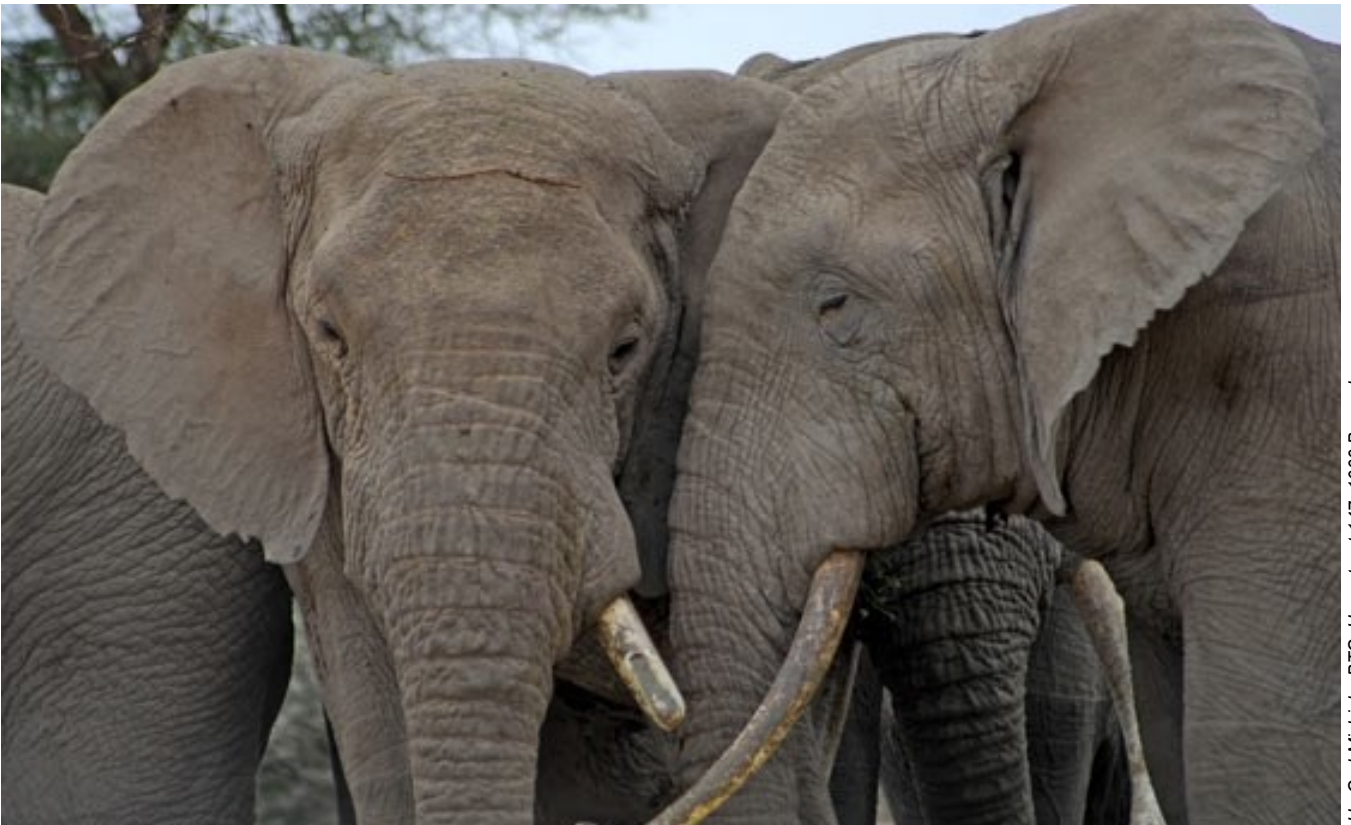
Olifanten en Sinya

Het is bewezen dat toerisme in beheer van de lokale gemeenschappen een belangrijke bron van inkomsten kan zijn voor de lokale bevolking en tegelijkertijd een belangrijke bijdrage levert aan de bescherming van de natuurlijke rijkdommen. Dit is het doel van Honeyguide Foundation in het noorden van Tanzania, met financiële hulp van het Trade for Development Centre. Misschien geniet u wel binnen enkele jaren van een onvergetelijke ervaring in de Enduimet WMA!