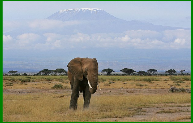
Enkele van de trekpleisters van Enduimet WMA: Olifanten en de Kilimanjaro