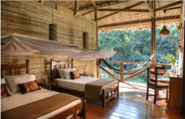
Ec lodge Refugio Amazonas, Peru

Gelijkaardige projecten hebben in het verleden al hun impact bewezen. Meer dan 20 jaar geleden daalde Rainforest Expeditions neer in het hartje van het Peruviaanse regenwoud. Op drie plaatsen in het woud bouwden ze ecolodges met de lokale bevolking als belangrijkste aandeelhouder. Plaatselijke families zagen hun inkomen verdubbelen, tot zelfs verviervoudigen. Het jaarlijks dividend dat aan de bevolking wordt uitgekeerd gaat naar educatie, gezondheidszorg en sociale bijstand. De opbrengsten uit toerisme vormen voor de bevolking meer dan ooit een drijfveer om boskappers en mijnwerkers op zoek naar goud te weren.