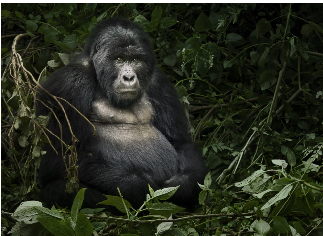
Berggorilla, Oeganda © Weesam 2010

Nu wordt de lokale gemeenschap betrokken bij de toeristische toestroom in het gebied. 20% van het toegangsgeld voor het natuurpark gaat naar de bevolking. Veel inwoners hebben werk gevonden in de sector, als uitbater van een hotel of souvenirwinkel. De gorilla's genereren nu inkomsten en dus doet de gemeenschap er alles aan om hen te beschermen.