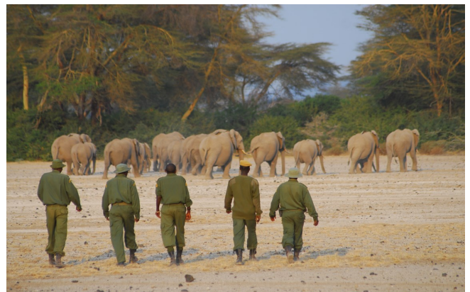
Rangers weren stropers uit het gebied

Eeuwenlang leefde de Masaï ten westen van de Kilimanjaro in harmonie met de plaatselijke planten- en dierenwereld, maar recentelijk heeft de toename van het bevolkingsaantal en het ontwikkelingsniveau dit evenwicht verstoord. De gemeenschappen nemen steeds meer land in gebruik voor landbouw en veeteelt. Hun behoeften aan natuurlijke grondstoffen zoals koolstof en hout zijn sterk gestegen. Landbouwers doden wilde dieren omdat ze hun gewassen vernielen, stropers zijn op zoek naar ivoor en het vlees van wilde dieren wordt gretig verhandeld op de lokale markt.