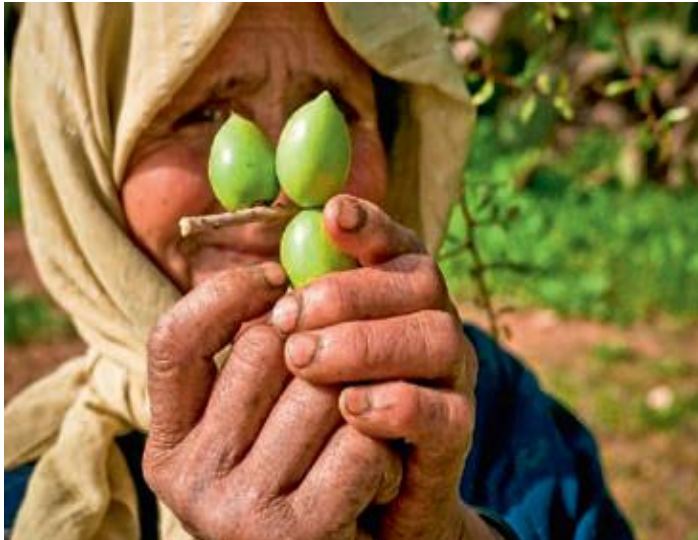
Les fruits de l'arganier