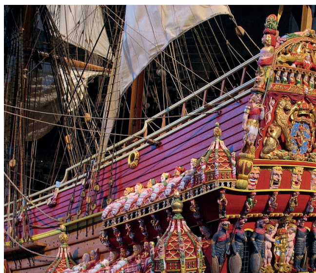
Regalskeppet Vasa