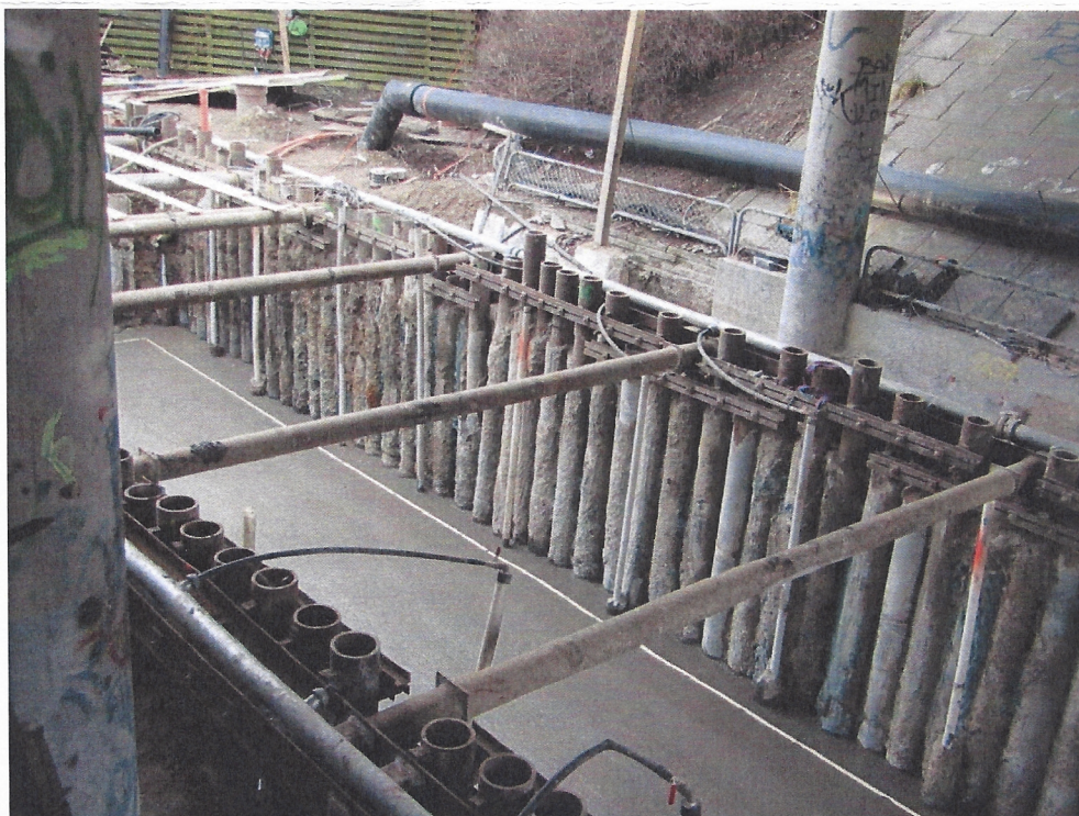
Billede 1: eksempel på en minisekantpælevæg.

Når man etablerer minisekantpælevægge foregår det ved at bore huller med en diameter på 30 cm ned til fast undergrund. Der skal bores et hul for hver 45 cm rundt om det nye bygværk, hvorefter vi støber hullerne med beton. Efterfølgende bliver der tilsvarende boret huller imellem de støbte pæle.