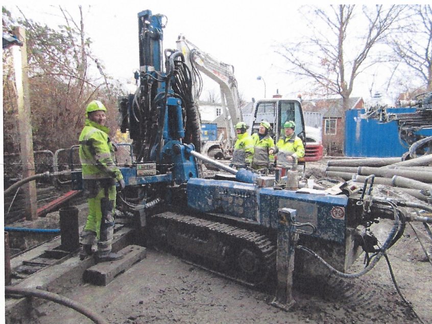
Billede 3: Boremaskine til sekantpæle.

Når minisekantpælevæggene er etableret, bliver jorden inden for minisekantpælevæggene gravet op, så der kan blive støbt en bundplade til det ny bygværk. Udgravning og støbning foregår uden grundvandssænkning. Herefter bliver bygværket tilpasset med beton, så de nye højvandsklapper kan blive monteret.