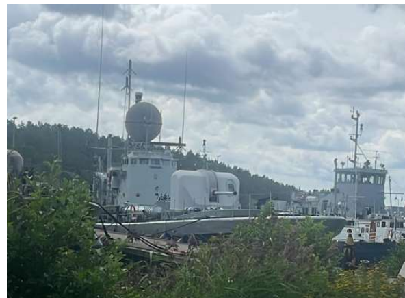
T121 Spica ligger förtöjd i augustivärmen.