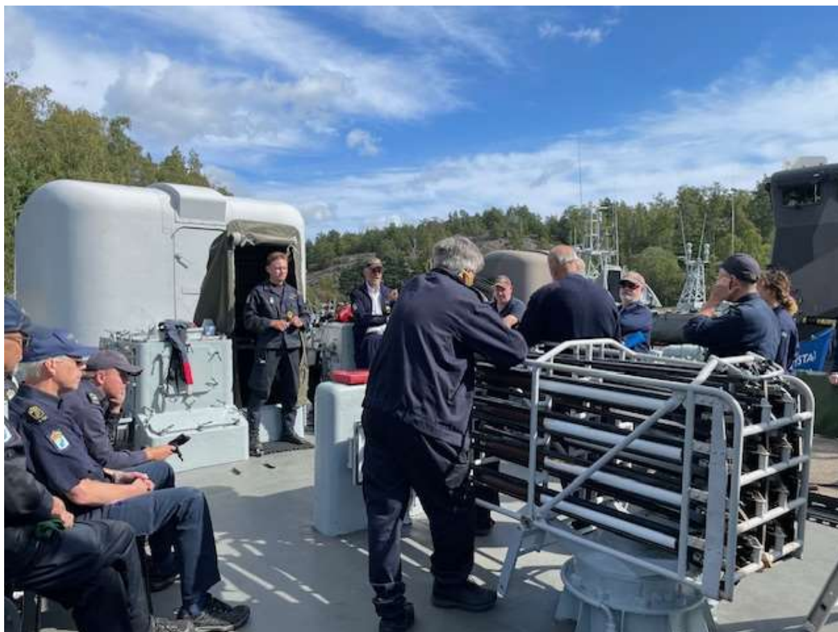
Besättningen har genomgång efter en lyckad körning.

Den 17 augusti var det dags för en mindre företagskörning, en 70-åring skulle firas med en nostalgitripp. Gålö bjöd som vanligt på bra väder, ärter och pannkaka samt god service. Det var ett mycket glatt gäng som åkte i väg på eftermiddagen. Det här är ett bra exempel på den typ av "specialsydda" körningar som vi kan ordna för hugade spekulanter.