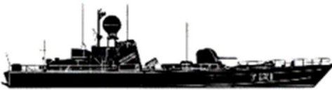
T121 Spica, den enda stjärnan på Gålöbasen

Jag återkommer i kommande kvartalsbrev med ytterligare information om olika delar av rederiets verksamhet i syfte att ge en allmän information till dig som medlem i Spica vänner.