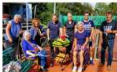
Seniorentennis met begeleiding

Jouw tennisclub voor Sportiviteit en Gezelligheid!