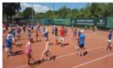
Trainingen verzord door gediplomeerde trainers

LTV Randenbroek bestaat meer dan 50 jaar en is een tennisvereniging met meer dan 800 leden. Daarmee zijn we de grootste (en stiekem ook de gezelligste) tennisvereniging en één van de grootste sportverenigingen van Amersfoort. Met 8 all-weather banen zijn we het hele jaar open.