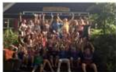
Het hele jaar evenementen voor jong en oud