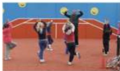
Proefcursus voor de jeugd