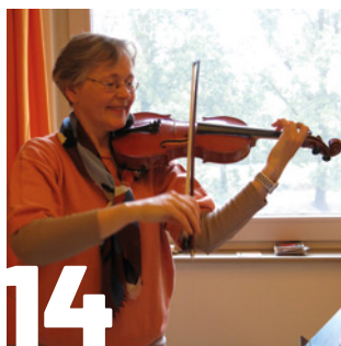
14 DE VROLIJKE VIOL

Deadline volgend nummer (januari/februari 2025): 23 november 2024.