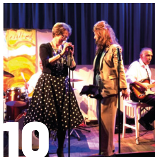
10 SWINGEN IN MUZIEKCAFÉ ZIELHORST