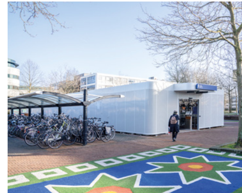
Fietsenstalling bij Station Schothorst