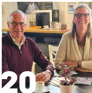
20 DENK MEE MET HET WBT