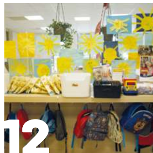
12 "KINDERBREIN OPTIMAAL PRIKKELEN"