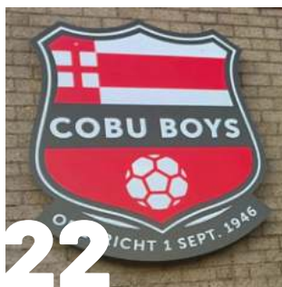
22 VOETBAL VOOR IEDEREEN