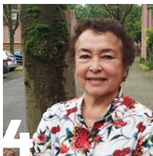
4 NAAILESSEN IN 'T MIDDelpUNT

Deadline volgend nummer (november/december 2024): 27 september 2024.