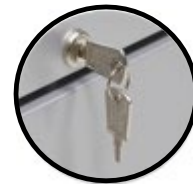
swissini Kühlschrank - large

Kühle Erfrischung für Ihre Unternehmung, nachhaltiger Einsatz für die Gemeinschaft