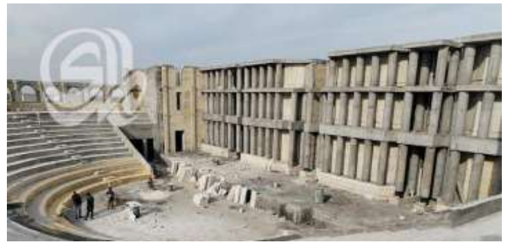
المسرح السومري تحفة معمارية وإيقونة ثقافية في مدينة اور الأثرية