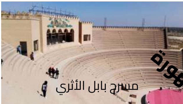
مسرح بابل الأثري

"هل يستطيع المسرح أن يصغي إلى نداء الاستغاثة الذي تطلقه أزممتنا، في عالم يجد فيه المواطنون أنفسهم مفقرين،