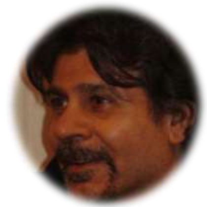
بقلم - سمير أمين

يساعد الفضول فسيولوجياً الدماغ على بناء مسارات عصبية جديدة و كلما غدينا فضولنا أكثر، كلما أصبحنا أكثر فضولاً. إن دماغنا مرن و حين نتعلم أشياء جديدة فإن ذلك يقوي