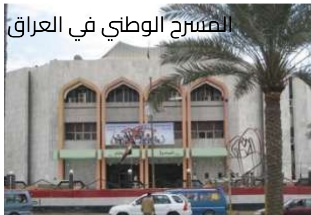
المسرح الوطني في العراق