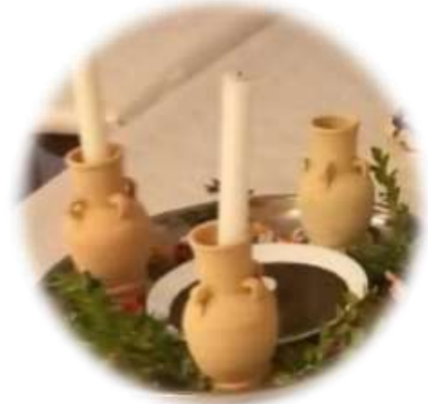
من سنوات في الوطن الأم العراق.

في ٩ شباط ٢٠٢٥ اقامت الجمعية نشاطا اجتماعيا فولكلوريا بمناسبة عيد زكريا حيث استذكرت الزميلات الموروث الشعبي لهذا اليوم بالشموع والياس، و تحدثن عن ذكريات الماضي و يوم زكريا مع عوائلهم