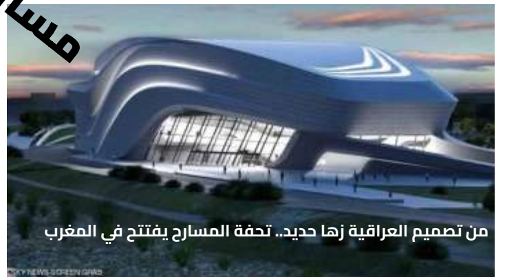
من تصميم العراقية زها حديد.. تحفة المسارح يفتتح في المغرب