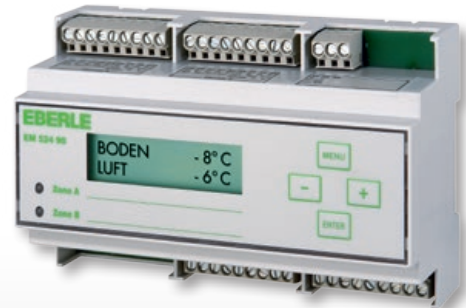
EM 524 90 – für 2 Zonen / for 2 zones