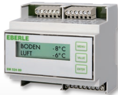
EM 524 89 – für 1 Zone / for 1 zone