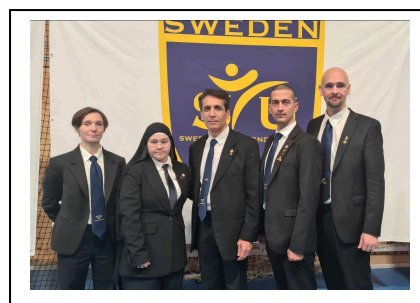
Domarlaget SM Poomsae, Linköping 5 november