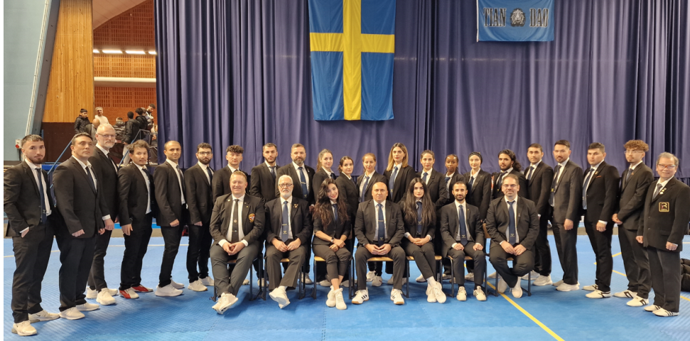
Domarlaget SM Kyorugi, Helsingborg 25 november