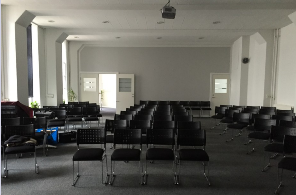
Norre Farimagsgade 45