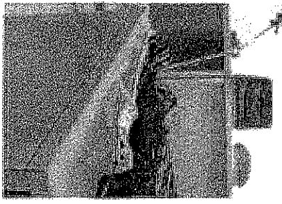
Disastrosa del tribunale