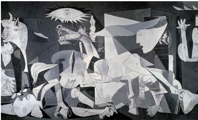
Guernica van Pablo Picasso