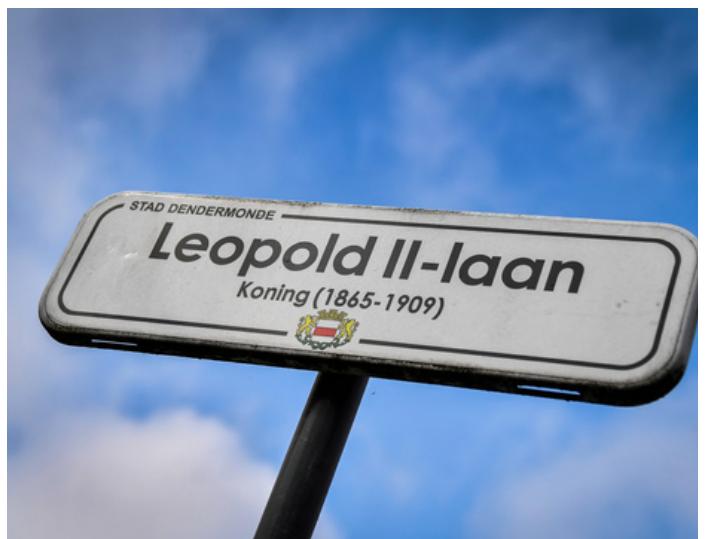
Leopold II-laan in Dendermonde