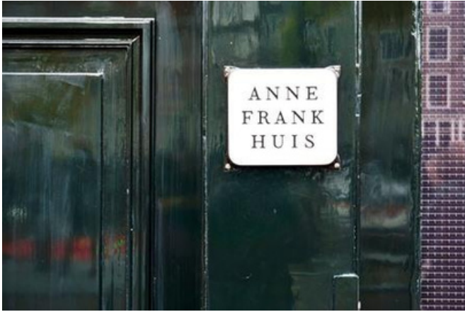
Anne Frank huis in Amsterdam