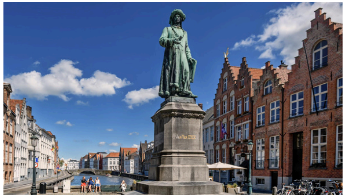
Jan Van Eyck