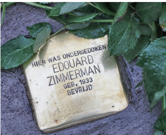
Struikelstenen van Gunther Demnig