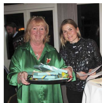
Julmat i all ära men det finns ju viktigare saker