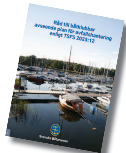
Broschyr från Svenska Båtunionen som finns att ladda ner från deras hemsida

Samtidigt skärptes kraven på hamnarna. Målet är att det skall bli lättare att lämna ifrån sig både toalettavfall och annat avfall så det inte riskerar att hamna i vattnet.