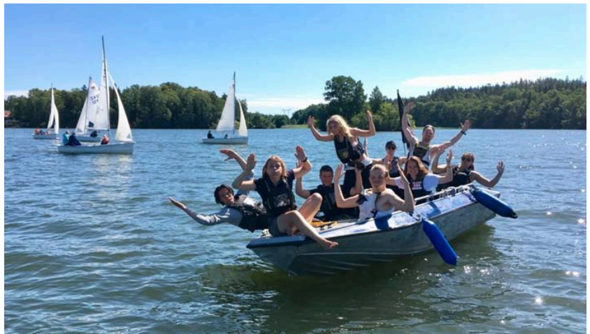
Nya bus, upptåg, påhitt och ideer varje läger

Att jag skulle hamna på Rasta var alltid självklart: min pappa var ledare och lägerchef under otaliga år, och jag hade seglat ända sen jag föddes. 2004 gjorde jag mitt första nybörjarläger och kom sen tillbaka varje sommar så länge jag fick. Efter 7 år som junior på Rasta började jag min karriär som ledare