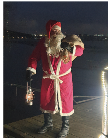
Det är inte bara SSS medlemmar som besöker Flytande Glöggmässan, utan även den uppskattade "sjötomten".

Med gemenskap, sociala aktiviteter och engagemang läggs en stabil grund för en mycket uppskattad och välkött båthamn.