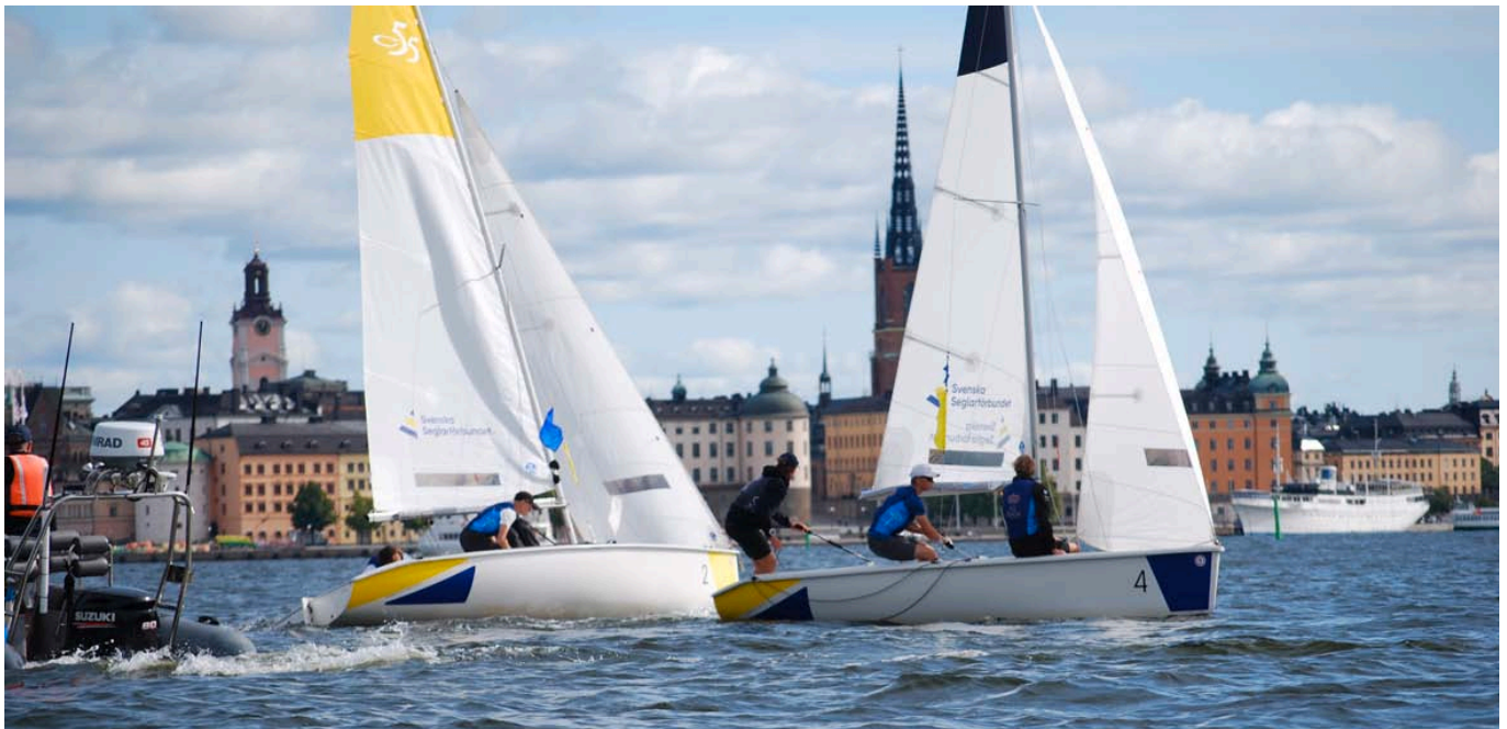
C55 dekoren har sponsrats av åKompani Reklam &amp; Skyftp Produktion

SSS fick mycket beröm från de deltagande klubbarna för ett väl genomfört arrangemang.