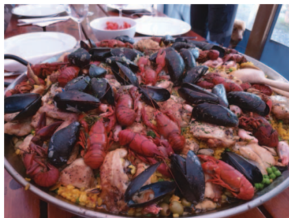
Paellamiddag för hamnens medlemmar

Tranebergsandan är sedan länge ett etablerat koncept – tillit, gemenskap, att kavla upp ärmarna och hjälpa till är alla viktiga