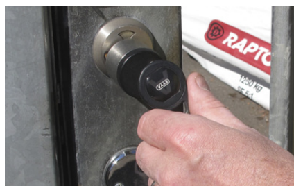
Bara att lägga "nyckeln" mot låset