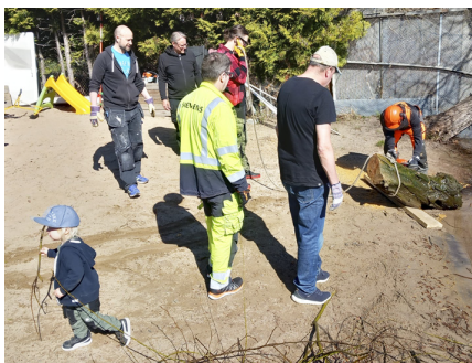
På städdagen hjälptes alla åt med härligt engagemang. Från att bära en hel kvist till att bärga bort gamla stockar vid sandstranden.

I samband med det så rensades alla gamla nycklar sedan många år tillbaka bort och nu har vi full kontroll på vilka som har access till hamnen, vilket känns tryggt och bra.