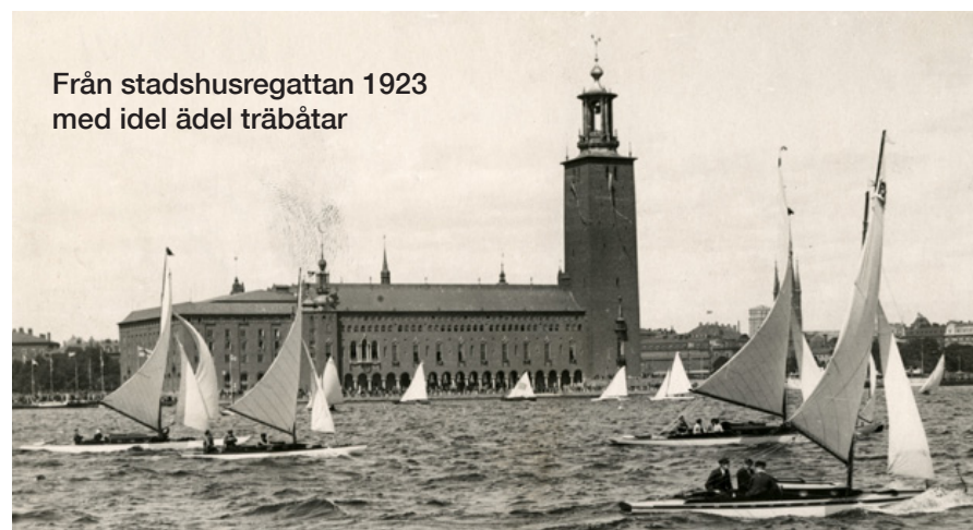
Från stadshusregattan 1923 med idel ädel träbåtar

Har du förslag på aktiviteter eller funderingar maila: klubbmasteri@stockholmssegelsällskap.se