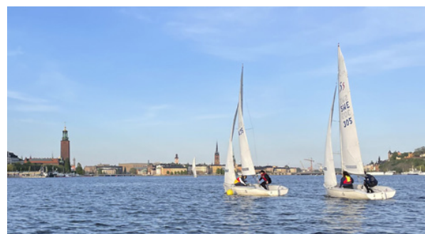
Ett par C55:or kämpar på Riddarfjärden.