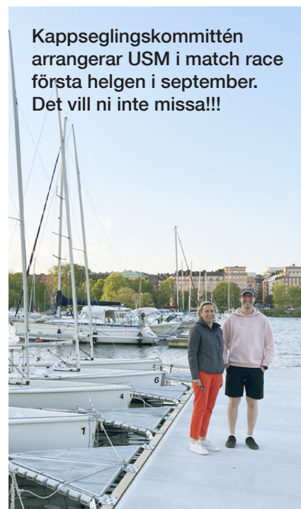
Kappseglingskommittén arrangerar USM i match race första helgen i september. Det vill ni inte missa!!!

Pia och Teodor är nöjda med de nya C55-platserna i Västerbrohamnen