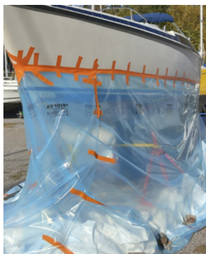
Föredömligt förberedd täckning.