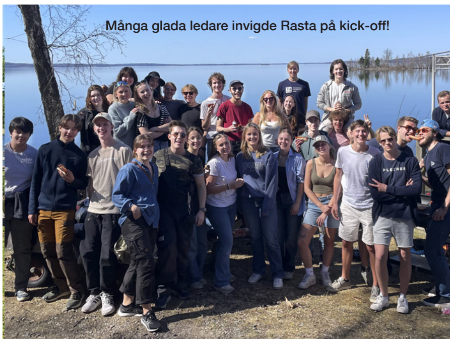
Många glada ledare invigde Rasta på kick-off!

När isen ligger i hamnarna så är det svårt att se framför sig att våren och sommaren faktiskt kommer att komma, men när isen väl spricker går det fort! Jollar ska mastas på och sjösättas, segel ska inventeras och nya tränare och ledare ska gå utbildningar.