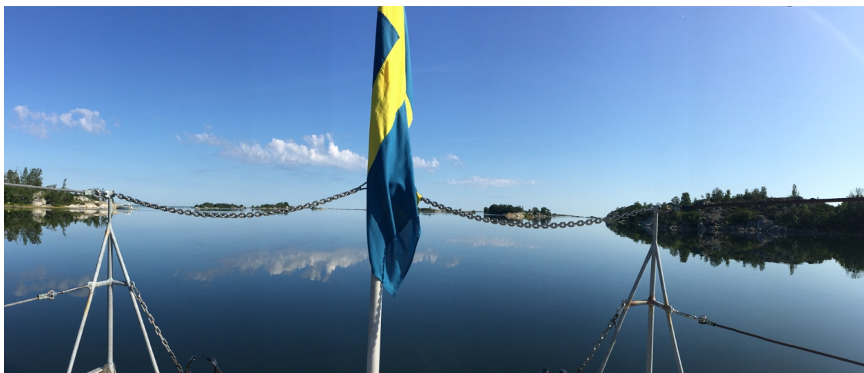
Norrpada Ö Vidingöra