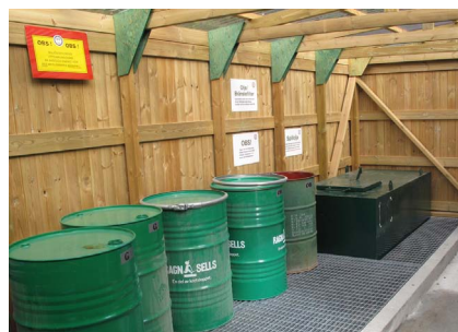
Var noga med att följa instruktionerna som finns uppsatta så det miljöfarliga avfallet kommer där det hör hemma. Lämna helst uttjänta batterier på inköpsstället alt återvinningscentral, i Skå t.ex. så minskar risken för inbrott i miljöstationen.

Låt oss tillsammans göra SSS till ett miljömedvetet segelsällskap!