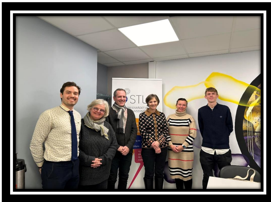
Møte med statsråden og styret i STL Bergen, ledet av daglig leder i STL Bergen