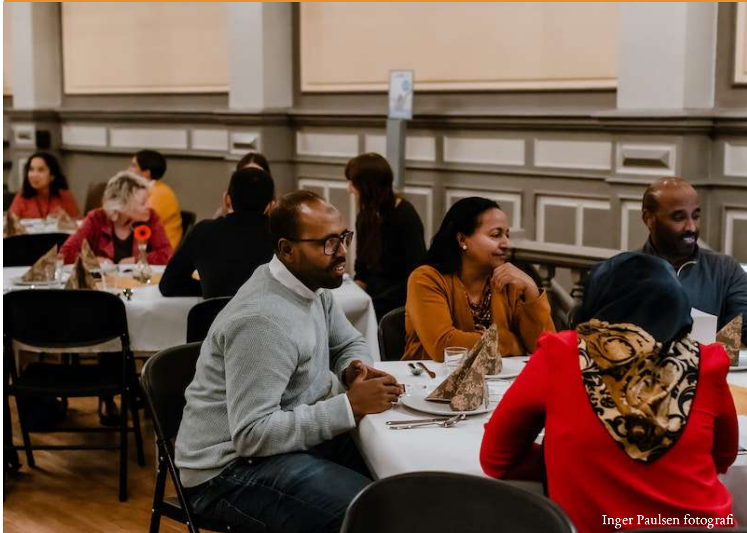
Inger Paulsen fotografi