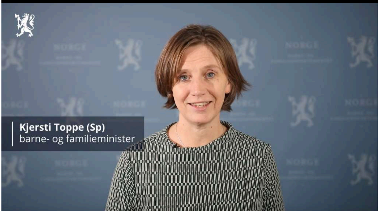
Kjersti Toppe (Sp) barne- og familieminister