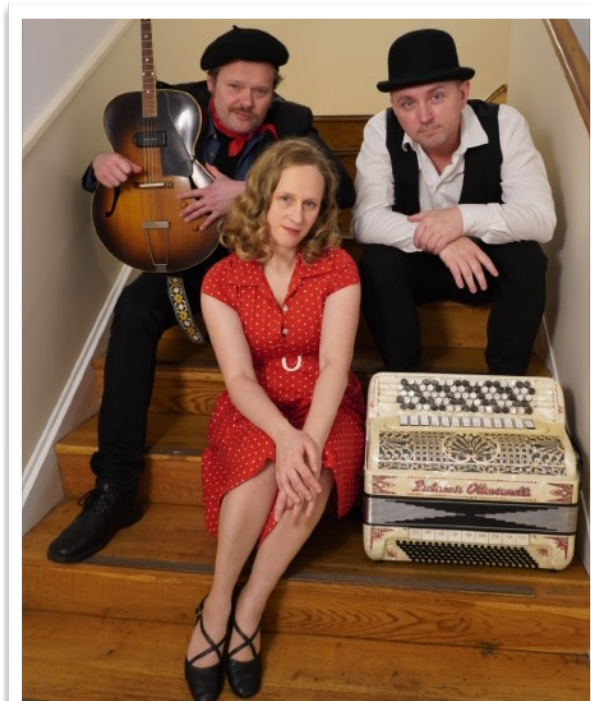
“Mademoiselle De Paris/Lille Frøken Paris”

En fortryllende blanding af virtuositet, passion,