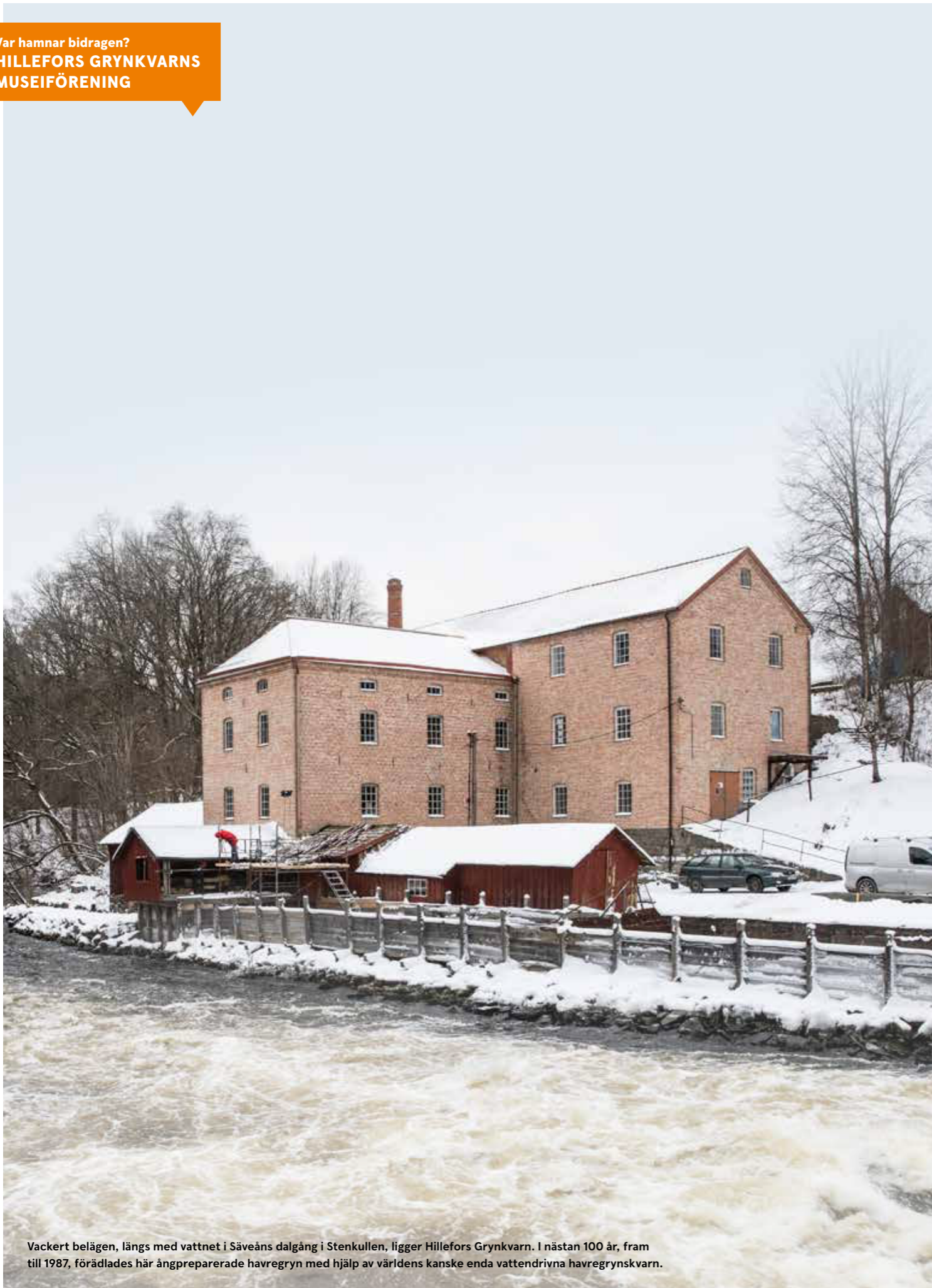
Vackert belägen, längs med vattnet i Sävåns dalgång i Stenkullen, ligger Hillefors Grynkvärn. I nästan 100 år, fram till 1987, förädlades här ångpreparerade havregryn med hjälp av världens kanske enda vattendrivna havregrynskvarn.