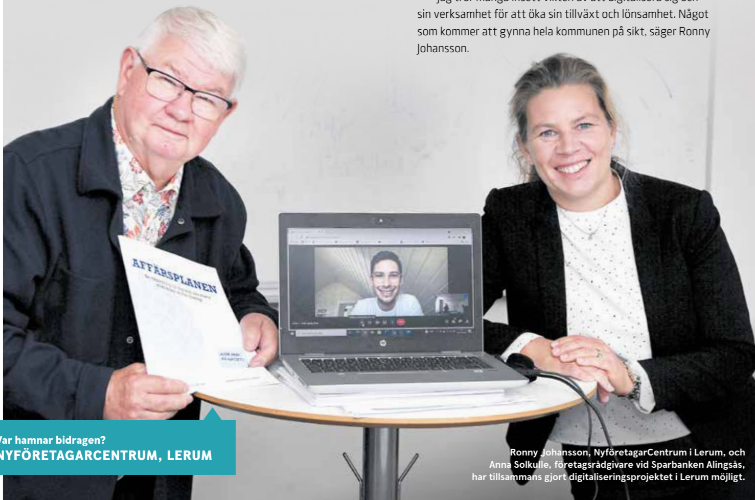
Var hamnar bidragen? NYFÖRETAGARCENTRUM, LERUM