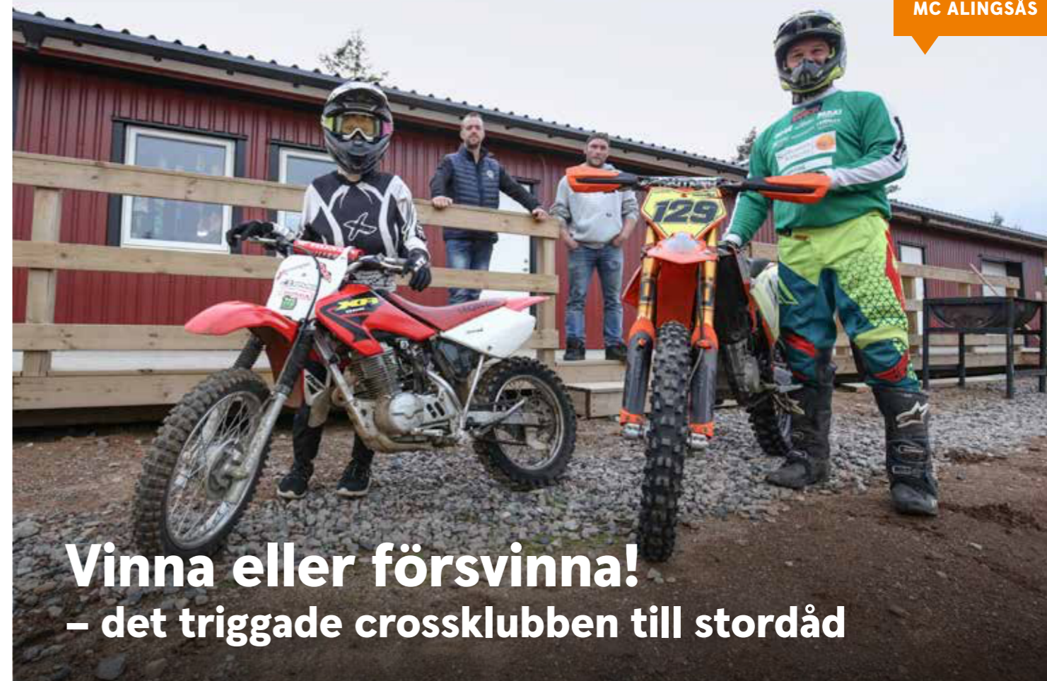
Var hamnar bidragen? MC ALINGSÅS