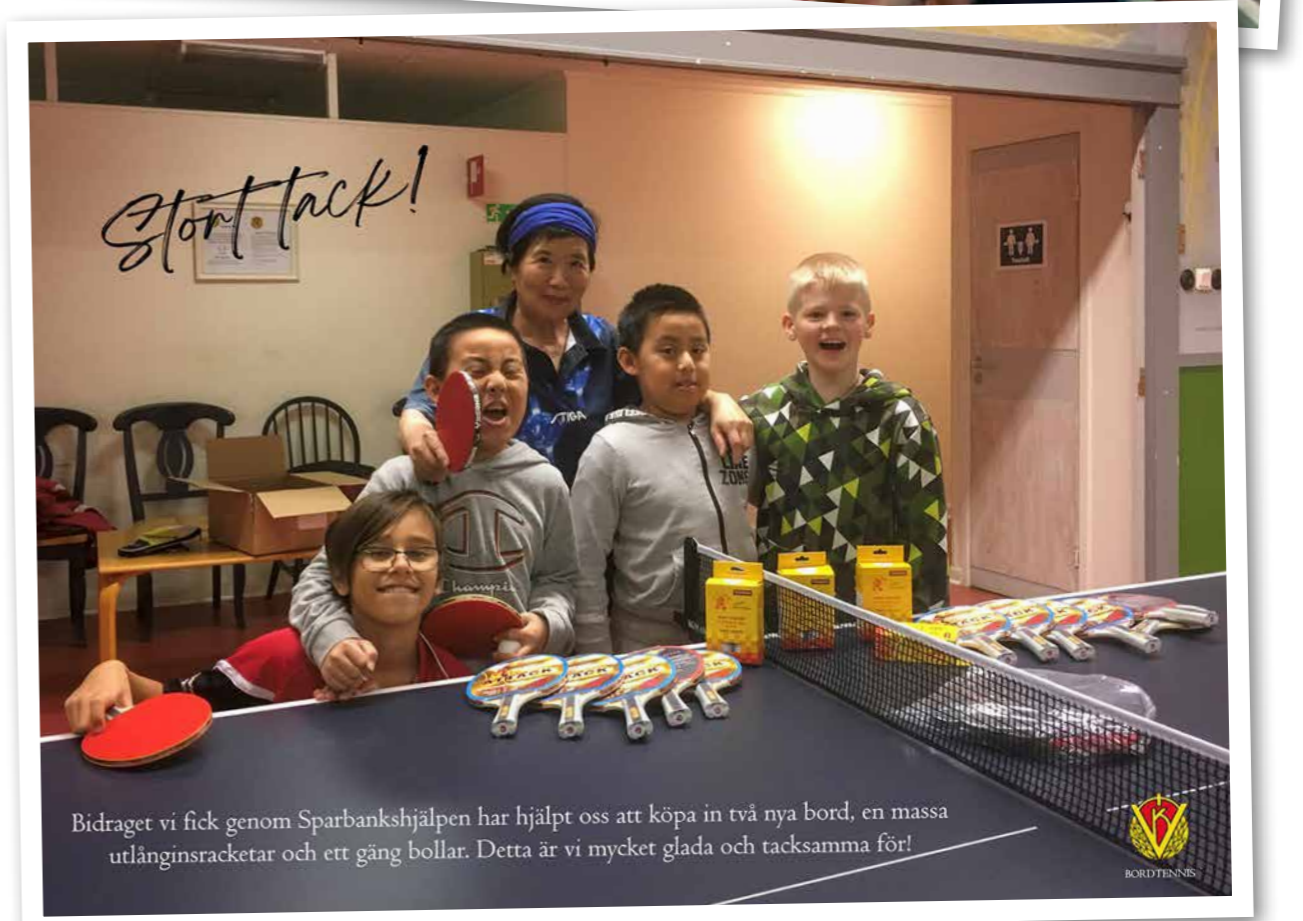
Bidraget vi fick genom Sparbankshjälpen har hjälpt oss att köpa in två nya bord, en massa utlåningsracketar och ett gäng bollar. Detta är vi mycket glada och tacksamma för!