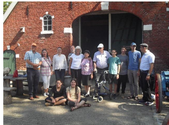
Familie Gans Zion met gasten bij 't Vunderinks museum

Website of op Facebook worden we hiervoor benaderd.