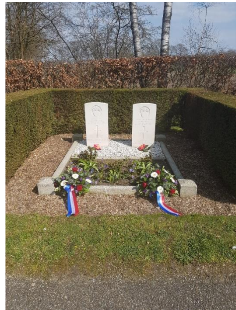
Graven van de Engelse soldaten

Bert Smeenk kwam in contact met hovenier René Reesink die al jaren twee graven van gesneuvelde Engelse soldaten bijhoudt op de algemene begraafplaats in Eibergen. Op een dag vond hij een potje met inhoud met een boodschap van familie van 1 van deze mannen.