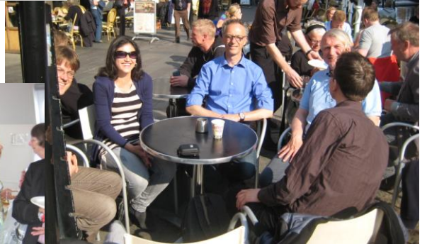
Bezoek aan Department of Science Studies, Aarhus University, Denemarken