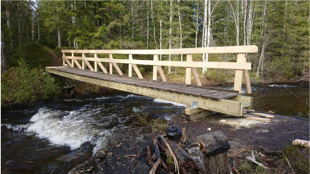
Bru med dobbel vange av 2x8 og tverrgående bord.