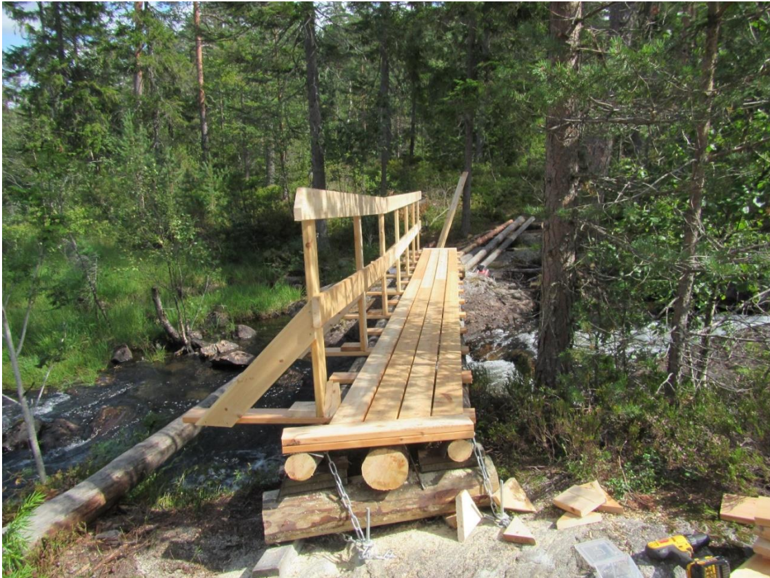
Bru med stokker og langsgående bord.