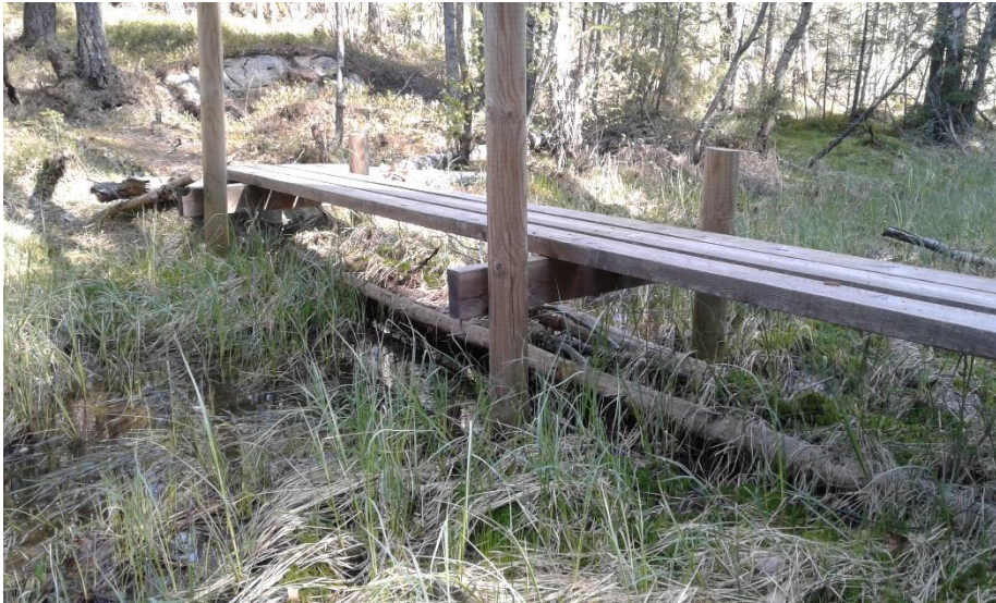
Bru på påler over vått terreng.