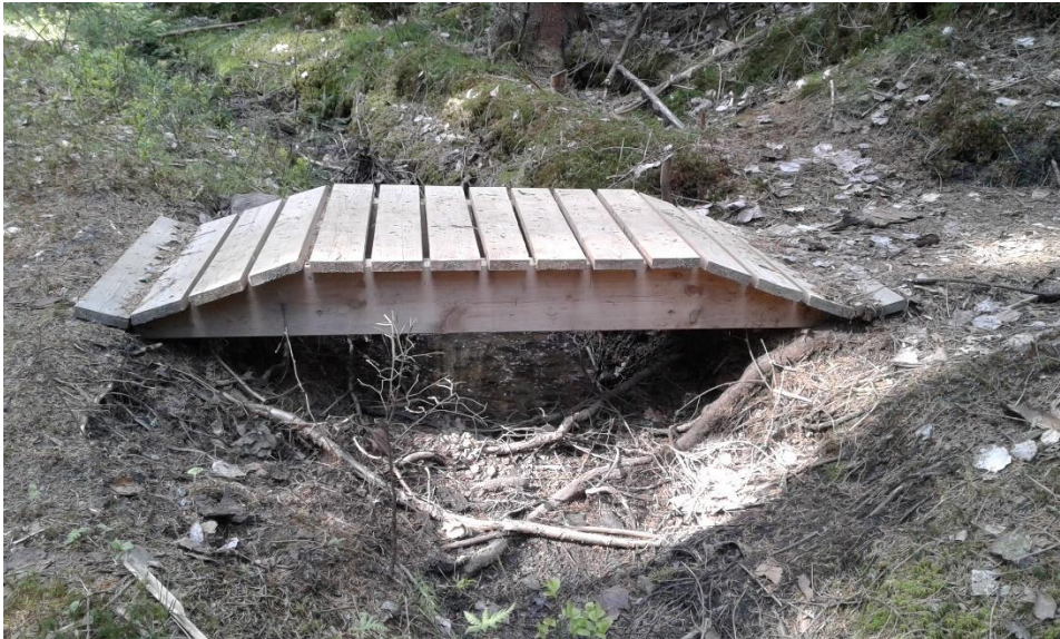
Liten, pen klopp, pent tilpasset og fint for sykkel.