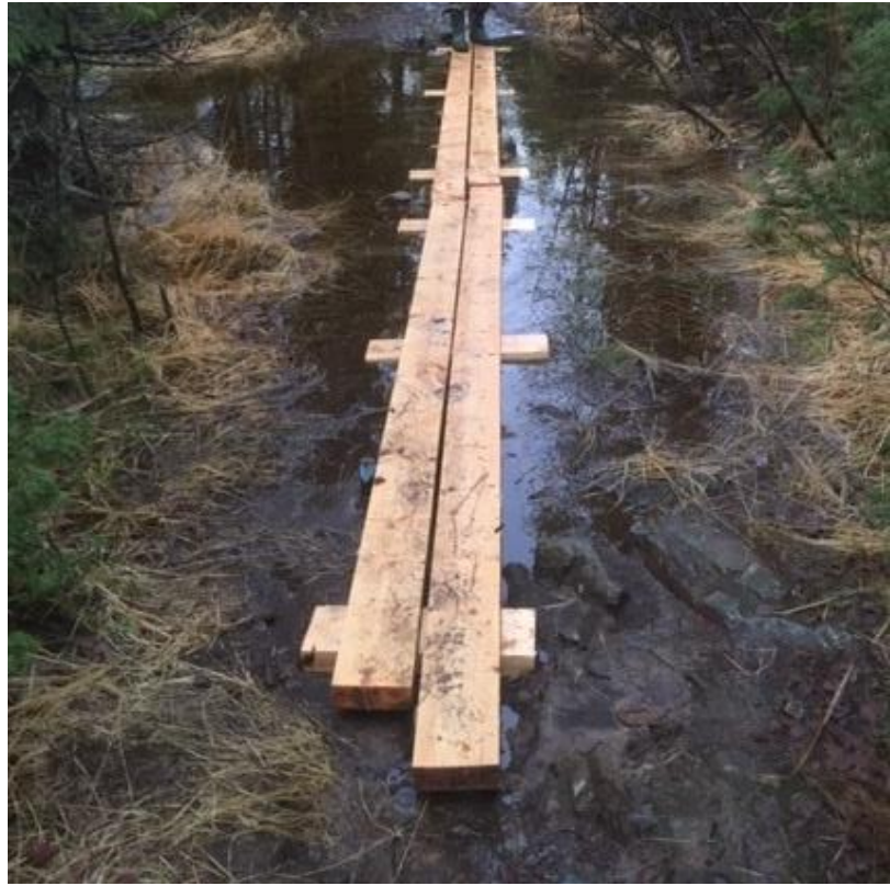
Gangbane kan lages med 2 eller 3 bord.