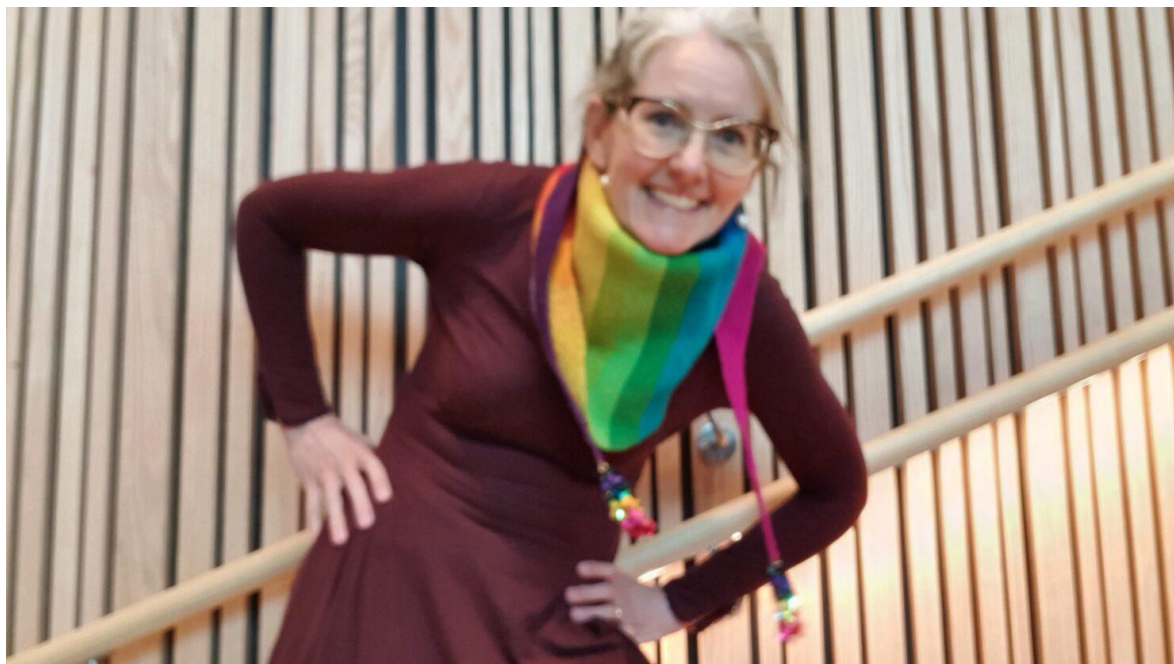
Strikket i enkel tråd Finull.

Både oppskriften og historien om designet sto på trykk i bladet garn i 2019. Rakk du ikke å sikre deg bladet, kan du lese hele artikkelen på Statistrikk.no. Søk etter «Gayssian».