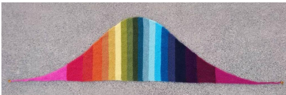
Strikket i dobbel tråd Mohair Luxe fra Lang Yarns.

Bildene viser et skjerf strikket i enkel tråd Finull fra Rauma, og et strikket i dobbel tråd Mohair Luxe fra Lang Yarns. Masketall er likt for alle variantene. Når oppskriftene avviker, er {instruksjonene for enkel tråd skrevet i rød tekst i klammeparenteser}, og [instruksjonene for dobbel tråd skrevet i blå tekst i firkantparenteser].