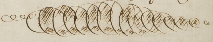
KU Leuven Bibliotheken, Bijzondere Collecties, ms. 250, f. 28v

Porcus alit doctos Volitat super oia falco.