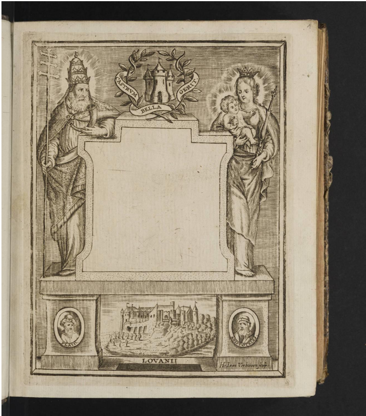
Pedagogie De Burcht KU Leuven Bibliotheken, 2Bergen - Campus Arenberg, PRECA0018, titelpagina