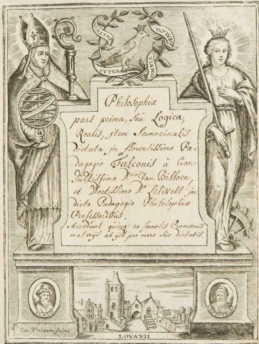
Pedagogie De Valk KU Leuven Bibliotheken, Bijzondere Collecties, ms. 241, titelpagina