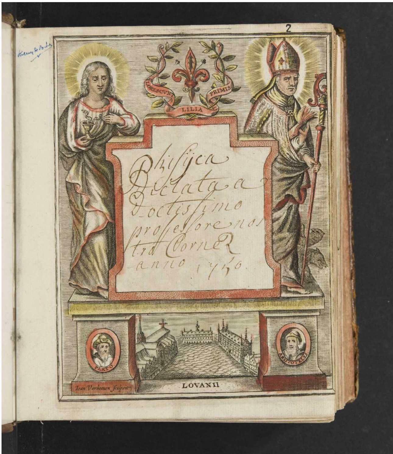
Pedagogie De Lelie KU Leuven Bibliotheken, Bijzondere Collecties, ms. 212, titelpagina