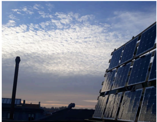
Lysinstallationen Solar Solids ved Kulturværftet i Helsingør