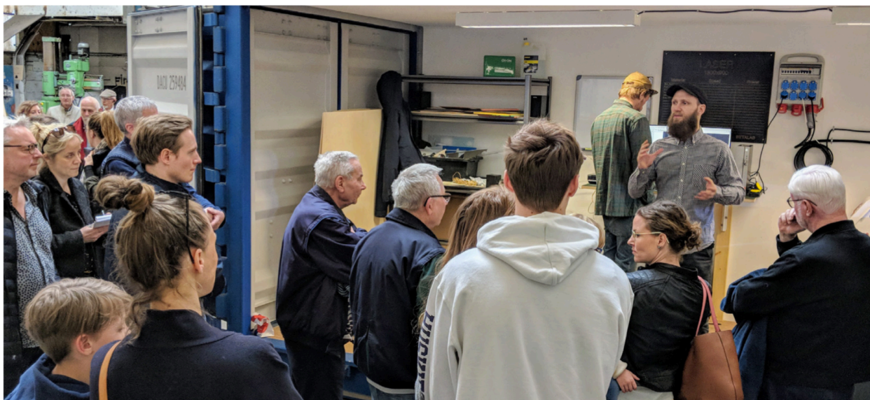
Åbning af vores makerspace i Hal 16