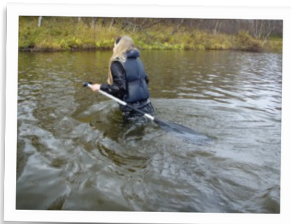
Uhell kan fort skje