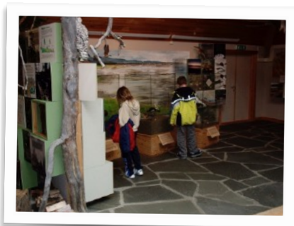
Kart og kompass på Naturhuset