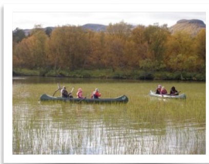
Padle i «gress»