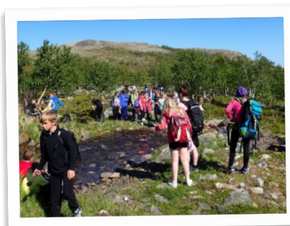
Topptur til månefjellet