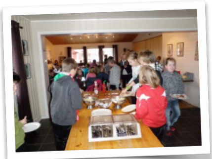
Mat for mons