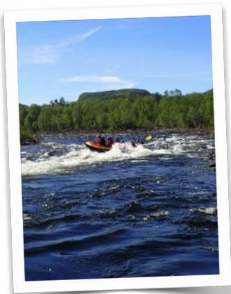
Rafting i Stabburselva