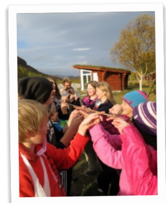
Best i lag