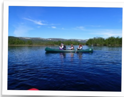
Kanosafari i Stabburselva