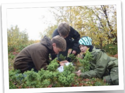
Natursti i nasjonalparken