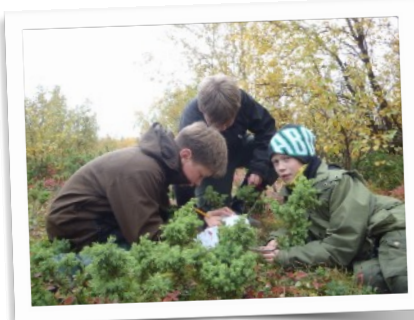
Natursti i nasjonalparken