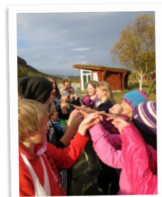
Best i lag