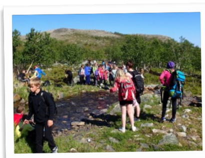
Topptur til månefjellet