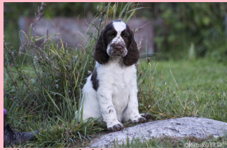
Vinnare valpklassen Ipa 8 v ägare Veronica Forsberg