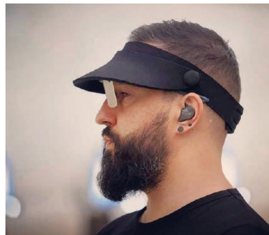
Intarso Genk, 2022

Gezondheidsproblemen in het voorjaar weerhielden me om gedurende een aantal maanden voluit te kunnen trainen en aan wedstrijden deel te nemen. Sinds kort heb ik opnieuw voldoende energie om m'n trainingen te hervatten. Die bestaan momenteel uit fysieke trainingen in de vroege ochtend. Op maandag, woensdag en vrijdag kan je me 's avonds in een schietstand vinden. Het weekend bestaat dan doorgaans uit deelname aan wedstrijden en de nationale trainingen in Mechelen. Ik overweeg ook nog om m'n middagpauzes op het