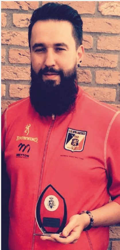
Vierlanden, Zwevegem, 2019