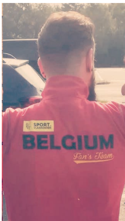
Vierlanden, Zwevegem, 2019

werk in te vullen met lichte trainingen zoals droog trainen, meditatietechnieken of het lossen van een paar schoten in een schietstand. Ik bekijk momenteel wat m'n opties zijn.