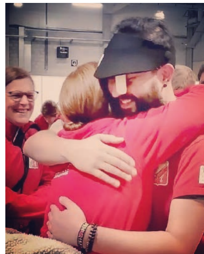
BOA 2021 na behalen van brons in finale