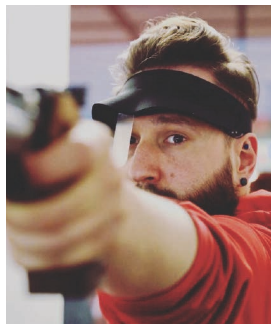
Schietstand KSPR, 2018