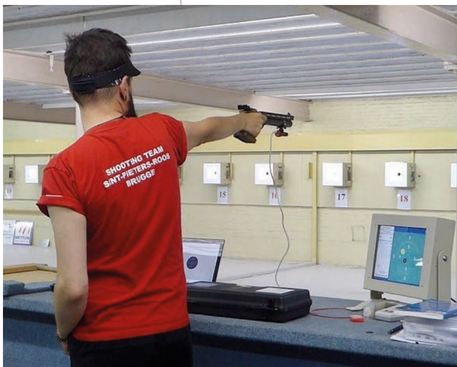
Nationale training in Mechelen