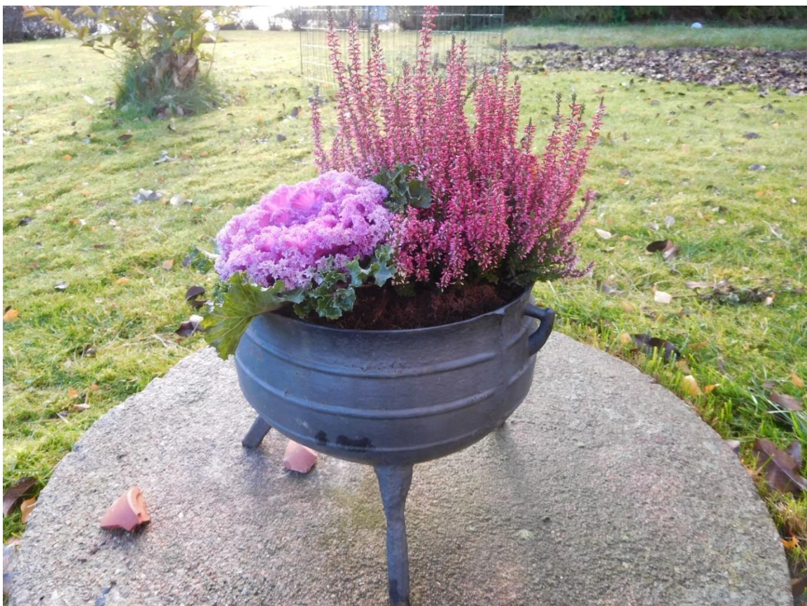
Hösten kan också vara fin med mjuka färger!

Vid anteckningarna : Kenneth Emanuelsson.