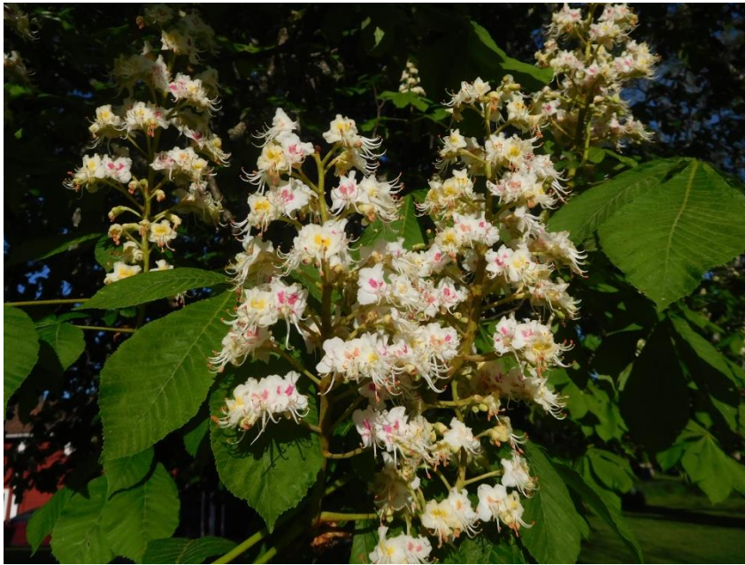
Hästkastanj, varje blomma som en liten orkidé!.