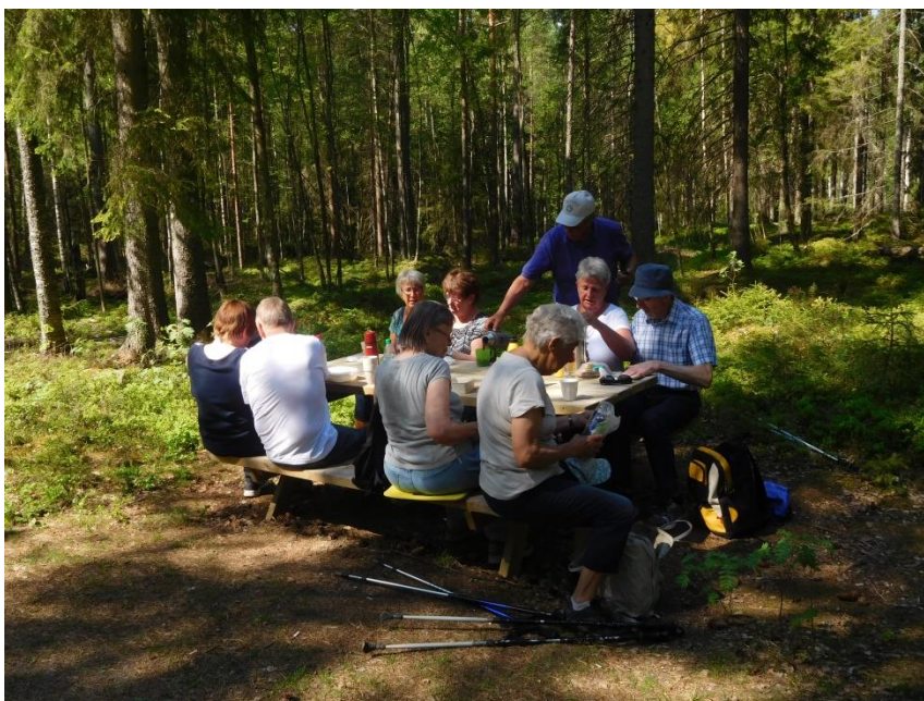
Bild på några av deltagarna på den varma, 28°, promenaden i Markaskogen.