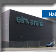
Hal 3, Elro Arena