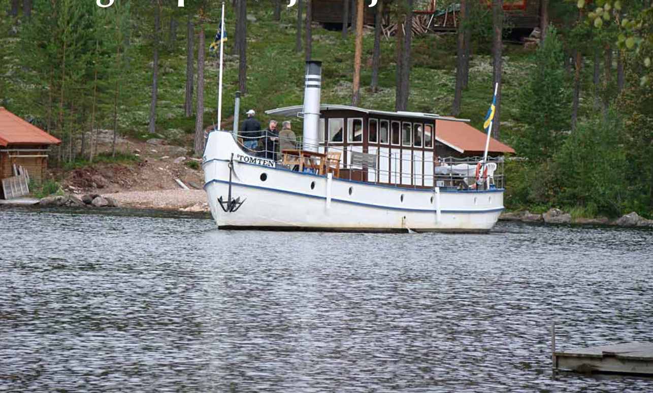
Tomten på besök i Rullboviken.

Å/F Tomten är en sevärd 150-åring med ett förflutet som flottningsbåt i Venjanssjön ända in på 1960-talet.