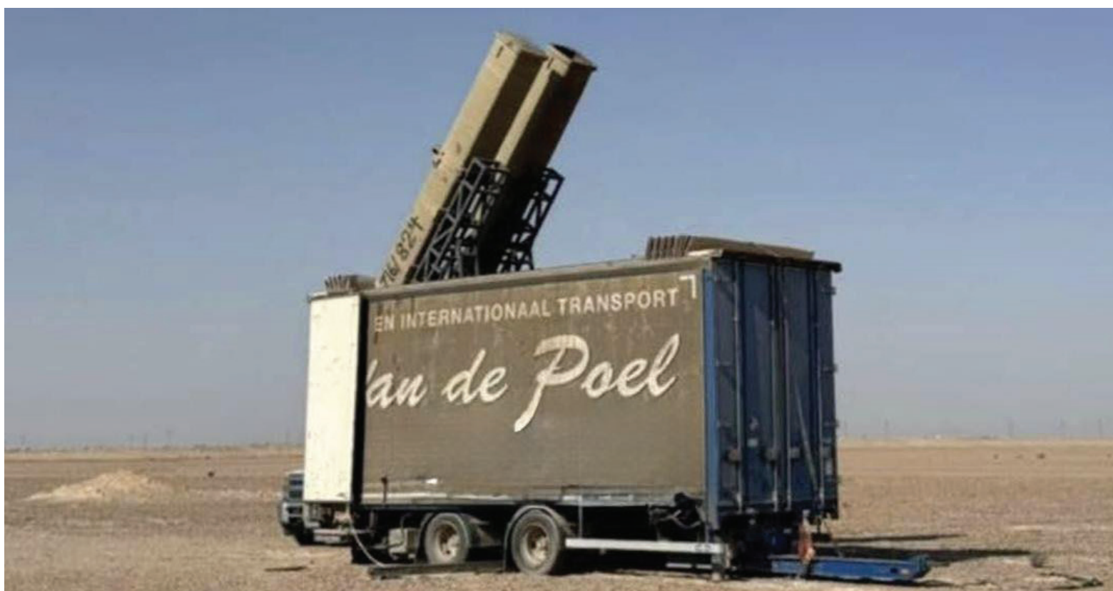
منصة لاطلاق الصواريخ عثر عليها في البصرة

وحذر دعوش من أن "استمرار الحرب سيؤدي إلى انهيار اجتماعي محتمل، حيث يعتمد نحو ٧٠ في المائة من السكان على رواتب الدولة والدعم الحكومي المرتبط بالنفط، كما ستفاقم أزمة الكهرباء لأن التوليد يعتمد على الغاز المصاحب للنفط، فيما يصعب الأمن الغذائي مهدداً بسبب توقف دعم الدولة للسلة الغذائية".