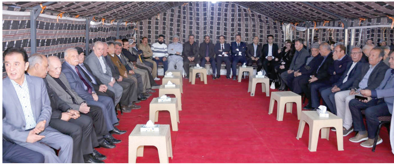
من مجلس عزاء الفقيه في مدينة أربيل