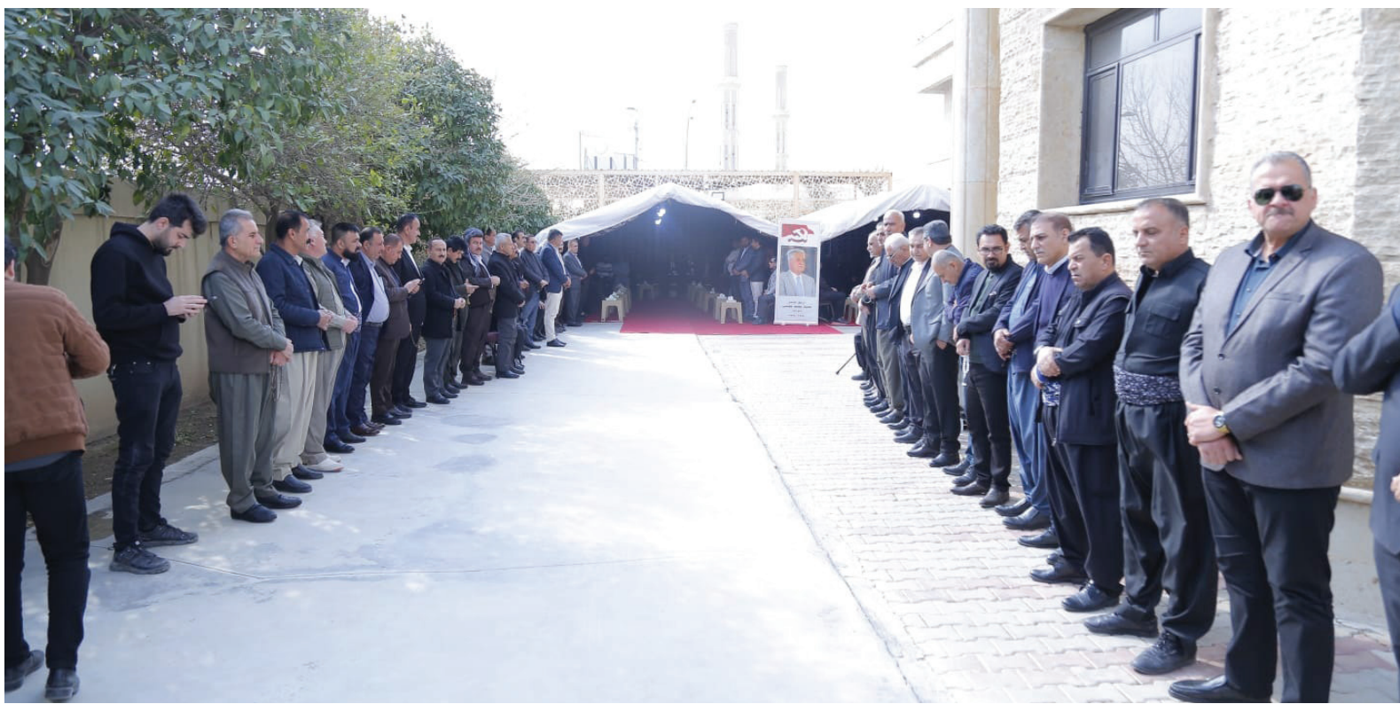
أربيل - طريق الشعب

أقام الحزبان الشيوعي الكردستاني والشيوعي العراقي مجلس عزاء في مدينة أربيل للفقيه الرفيقي حميد مجيد موسى (أبو داود)، السكرتير السابق للحزب الشيوعي العراقي، وسط حضور واسع من ممثلي الأحزاب الكردستانية وشخصيات سياسية واجتماعية.