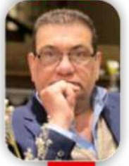
د. سلام قاسم

الديمقراطية هي نظام متكامل يحكم الشعب من خلاله نفسه بنفسه، عبر ممثلين يتم اختيارهم من خلال الانتخابات، بمعنى أن الأغلبية تحكم مع الحفاظ على حقوق الأقلية. في العراق اختارت النخب السياسية الحاكمة وبالالتفاق مع الحاكم المدني بريمر، بعد سقوط نظام صدام، نظاماً برلمانياً ديمقراطياً يحكم العراق. إذ تبني نموذج "الديمقراطية التوافقية" وهو النموذج الأكثر صلاحية للمجتمعات المتعددة الهويات التي لم تتجذّر في عملية صهرها في أمة واحدة، ولكن ما حصل في العراق أن العملية السياسية لم تكن مبنية على الديمقراطية التوافقية بل على نظام سياسي مبني على التوافقية الطائفية، وإن هذا النظام لن يقدّ البركات تماماً إلا في نظام ديمقراطي يلبي طموحات الشعب، خرج الآلاف من المواطنين لانتخاب ممثلهم في البرلمان، ومن ثمّ انتخب أعضاء البرلمان حكومة وطنية.