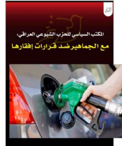
المكتب السياسي للحزب الشيوعي العراقي، مع الجماهير ضد قرارات إفقارها

التشريعية، الضعيفة أصلاً نتيجة ارتفاع الإلتفاق على عقود السيارات الذي يشكل نسبة مهمة من مدخلهم الشهري، إضافة إلى تأثير هذه الزيادات لاحقاً على مستويات الأسعار ورفع