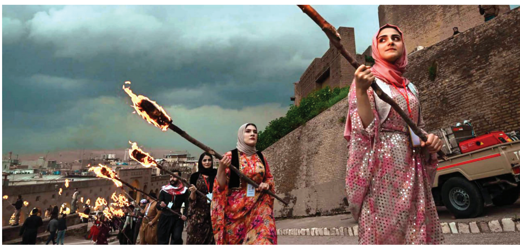
شابات وشبان يستعدون لإيقاد شعلة نورووز قرب قلعة اربيل التاريخية

وأكد فهمي، أن العراق يشهد حالياً تطوراً رأسمالياً منفلتاً، موضحاً أن «الاقتصاد الرأسمالي المنفلت حتى في الدول الرأسمالية المتقدمة، يخضع لقوانين وتنظيمات وحركات نقابية، تحد من استهتار الرأسمال وتجاوزته على الحقوق الأساسية للعمال». ولفت إلى أن «القوانين الموجودة اليوم غير مُنفذة،