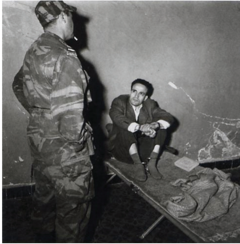
العربي بن مهدي

جاء فيلم «العربي بن مهدي» في وقت تحتاج الجزائر كي تقفز إلى الأمام أن تتأمل ماضيها التاريخي الناصح والإنساني الشجاع، أن يلتفت الجزائري اليوم إلى أن تحقيق الاستقلال ليس مسألة بسيطة، وأن بناء الدولة المعاصرة الحديثة ليس أقلّ جهداً وتضحية من بناء الاستقلال، وأن لا استقلال من دون دولة وطنية قوية سياسياً واقتصادياً