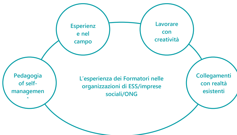
Grafico 2: L'esperienza dei Formatori nelle organizzazioni/imprese sociali/ONG di ESS

I partecipanti alla survey hanno indicato come molto importante che i formatori: