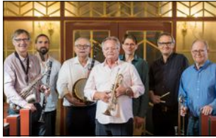
Magnolia Jazzband.